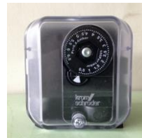
▲ファン運転確認用圧カスイッチ(独)クロムシュレーダー社

もしファンが停止したことに気付かないまましていると、ファン翼車の損傷や炉内の温度が上昇しすぎてしまう等、危険な状況になる可能性があります。ファン運転確認用の圧カスイッチを取り付けておけば、万が一、ファンが停止した場合に燃焼を停止するというインターロックを行うことができます。