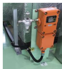
▲吸引式ガス検知器(写真上・下いずれも新コスモス電機社製)

ガスが検知部へ自然に浸透する方式。周囲にガスが滞留することにより内部のセンサが反応して警報部に信号を出す。取付けはガス配管ユニット周辺に設置することが多い。※ガスの比重により取付け場所を考慮すること。都市ガスはユニットの上部、LPGはユニットの下部に設置する。