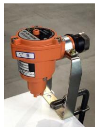
▲拡散式ガス検知器

ガス検知器といえば拡散式ガス検知器のみを設置している設備が多いようです。しかし最近の事故報告では炉内の未燃ガスが爆発するケースが伝えられています。拡散式ガス検知器は燃焼配管ユニット周辺でガス漏れを検知する機器であり、炉内の未燃ガスを検知することはできません。事故を防ぐためには拡散式と吸引式、両方のガス検知器を設置することをお勧めします。