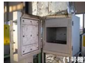
テスト炉(熱風循環式)

お陰様で毎月多くのテスト依頼を頂いています。今回のワークは鉄の塊。鉄の塑性加工のひとつに「型鍛造」という工作法があります。塑性加工とは金属が外力を受けたときに変形し、その外力を取り除いても変形が元に戻らない、永久変形する性質を利用したものです。教科書には「成形すべき製品の形状に合わせた金型で材料の表面の大部分を同時に加圧して成形する」このように書いてありますが、実際の運用をお手伝いさせていただくと、型自体を一定の温度に保つのがポイントであることを実感します(高過ぎても低すぎてもダメ)。その温度に独自のノウハウがあるのです。今回は型の加温をお客様と二人三脚で進めています。少しでも要望に近づけるよう努めます。(伊藤マイスター)