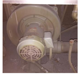
プロワファンが原因でした

先日、アルミ溶解炉を使用しているお客様から「火が着かない」と連絡があり、「突発」に出動しました。原因を調査すると、燃焼用エアを送るプロワのサーマルがトリップしていました。ベアリングが経年劣化し、軸がスムーズに回らなくなったことで過電流が流れ、安全装置が働いたことが原因でした。