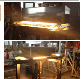
近赤外線ヒーターによる照射

今回のワークテストは鋼板を使つての急速昇温のテストです。目標は3分以内に800℃までの昇温でしたが、まず、熱風を使ってテストをしたところ5分もかかってしまいました。そこで、近赤外線ヒーター(短波長・ヘルスヒーター)に変更。このヒーターは写真の様に電源をONにしてから数秒で明るく発光・発熱し、被加熱物に対して強烈な波長を照射します。結果として、2分30秒の加熱時間に短縮することができました。これでお客様の処理条件要求を満たした設備を立案することができそうです。急速昇温を行うにあたって、照射距離・表面温度など条件設定によりその効果は様々で、更にテストを重ね最適な波長域を探ることができれば、今以上の時短も可能かもしれません。常にベストな結果を求め、今後もテストを継続していきます。熱のことならエコムにお任せください。(次回に続)