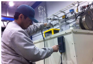
↑ 残存酸素濃度の測定風景

ダイキャスト工場などにおいては多数のルツボ炉が設置してあるケースがあり、このような場合、それぞれ個別に1台ずつ点検・省エネ診断を実施すると時間とコストが掛かってしまいます。詳細な調査を必要とする場合はこの方法が良いのですが、やはり効率が良くありません。そのような場合、まずは、全バーナーの燃焼排ガスの残存酸素濃度を計測し、全体の燃焼状態を把握します。その中からピンポイントでバーナーの不完全燃焼状態を見つけ、エネルギー使用の効率化や安全性の向上を改善するのです。状態の悪い設備だけ手を入れることで、コストと時間を上手に使いませんか？エコムでは貴社に最適な方法での診断をご提案・実施いたします！